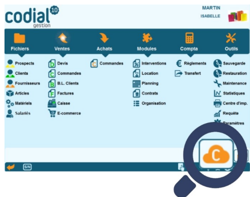
Écran Codial : accès CodialWebCenter